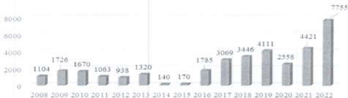
Trafic comparativ mișcări aeronave în perioada 2008-2022